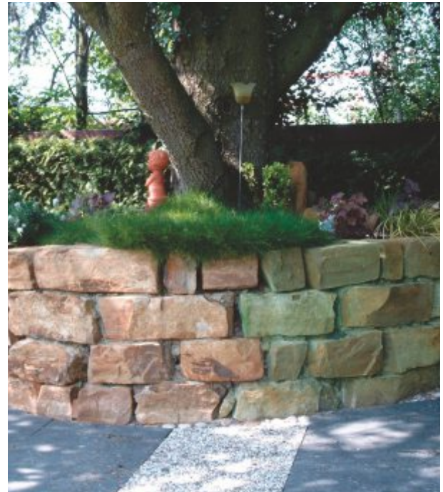
Natursteinbeet: Rechts vergrünt, links mit Lotuclean gereinigt und mit Lotupor imprägniert.

verstopft werden. Die Poren bleiben luft- und wasserdampfdurchlässig.