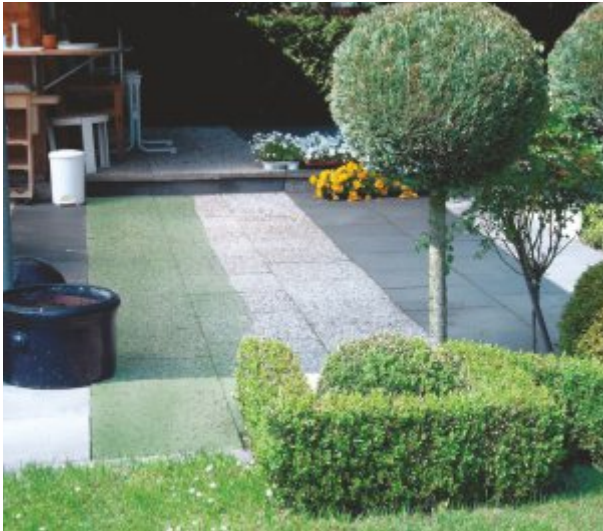
Fassade nach Beregnung: Links mit Lotupor behandelt daher trocken und hell, rechts nass, daher dunkler.

Soll die Oberfläche jedoch gereinigt werden, dann sollte die