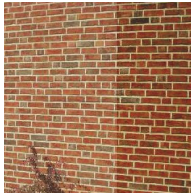
Fassade nach Beregnung: Links mit Lotupor behandelt daher trocken und hell, rechts nass, daher dunkler.

Es ist also wichtig, dass die Wand ihre natürliche