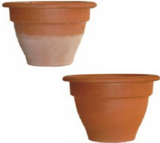
Terrakotta-Blumentöpfe: Links ohne Lotupor mit hässlichen Ausblühungen, rechts mit Lotupor-Imprägnierung ohne Ausblühungen.

Der durch Lotupor erzeugte Abperleffekt (Lotuseffekt) kann nur durch stark alkalische oder Fluss-Säure enthaltende Steinreiniger zerstört werden, die Sie daher nicht benutzen sollten. Nach der Lotupor-Behandlung benötigen Sie derartige Reiniger allerdings auch nicht mehr, da Schmutz falls er nicht vom letzten Regen abgespült wurde, mit dem Wasserstrahl eines Gartenschlauchs entferbar ist.