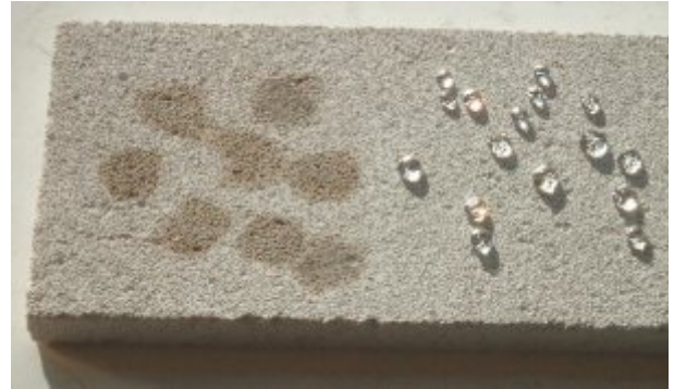
Die rechte, behandelte Steinhälfte zeigt deutlich die wasserabstoßende Wirkung von Lotupor. Die linke, unbehandelte Steinhälfte hat die Wassertropfen sofort aufgesaugt.

Reinigung vor der Imprägnierung mit Lotupor vorgenommen werden. Eine nachträgliche Intensiv-Reinigung durch Sandstrahlung oder aggressive Chemikalien beeinträchtigt den Oberflächeneffekt der Lotupor-Imprägnierung.